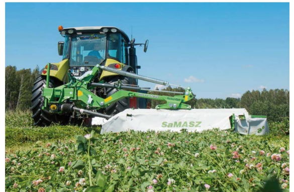
KDTC 260, KDTC 260 S, KDTC 260 W